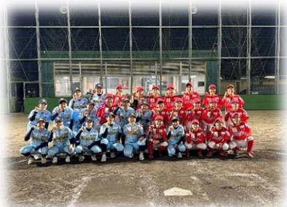
(試合後の記念写真)