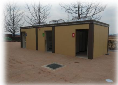
(新たに建設した野球場トイレ外観)