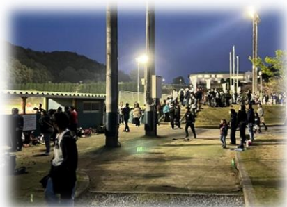
(令和5年4月8日オープニングゲーム)