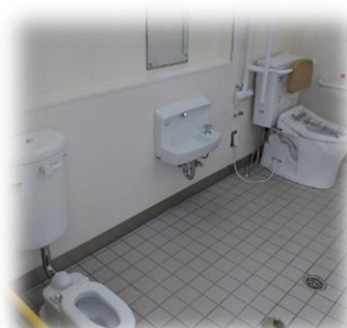
(多機能トイレ内観)